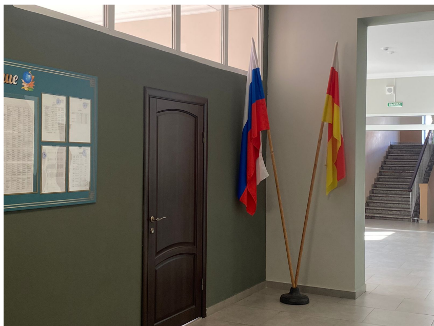
В 2023 ГОДУ ШКОЛА БЫЛА ОТКРЫТА ПОСЛЕ КАПИТАЛЬНОГО РЕМОНТА